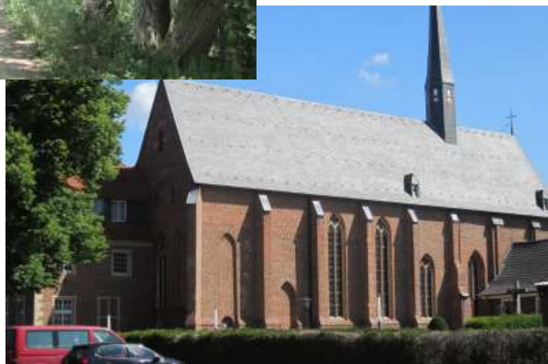
Klooster bij Burlo