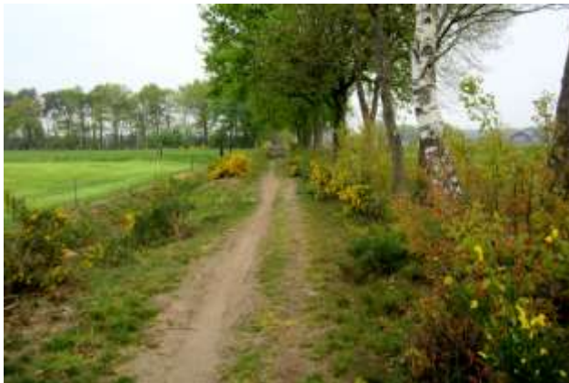
Het Kolkstroeterpad in april.