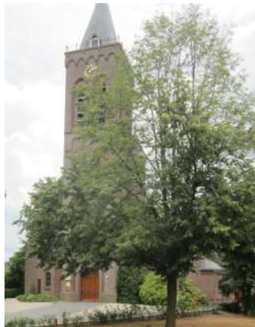
Nieuwe Helenakerk en Ludgerboom

In 1992 werd rechts voor de nieuwe St. Helenakerk deze boom door de burgemeester van Aalten, de dominee en de pastoor geplant. Het was het jaar waarin herdacht werd dat St. Ludger 1250 jaar geleden in het toen Friese Zuilen bij Utrecht geboren werd. De boom is een koningslinde.