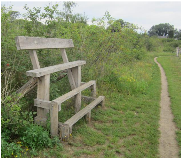
Bank met uitzicht op een plas met vogels