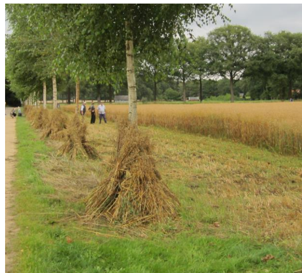
Oogst van de haver (juli)