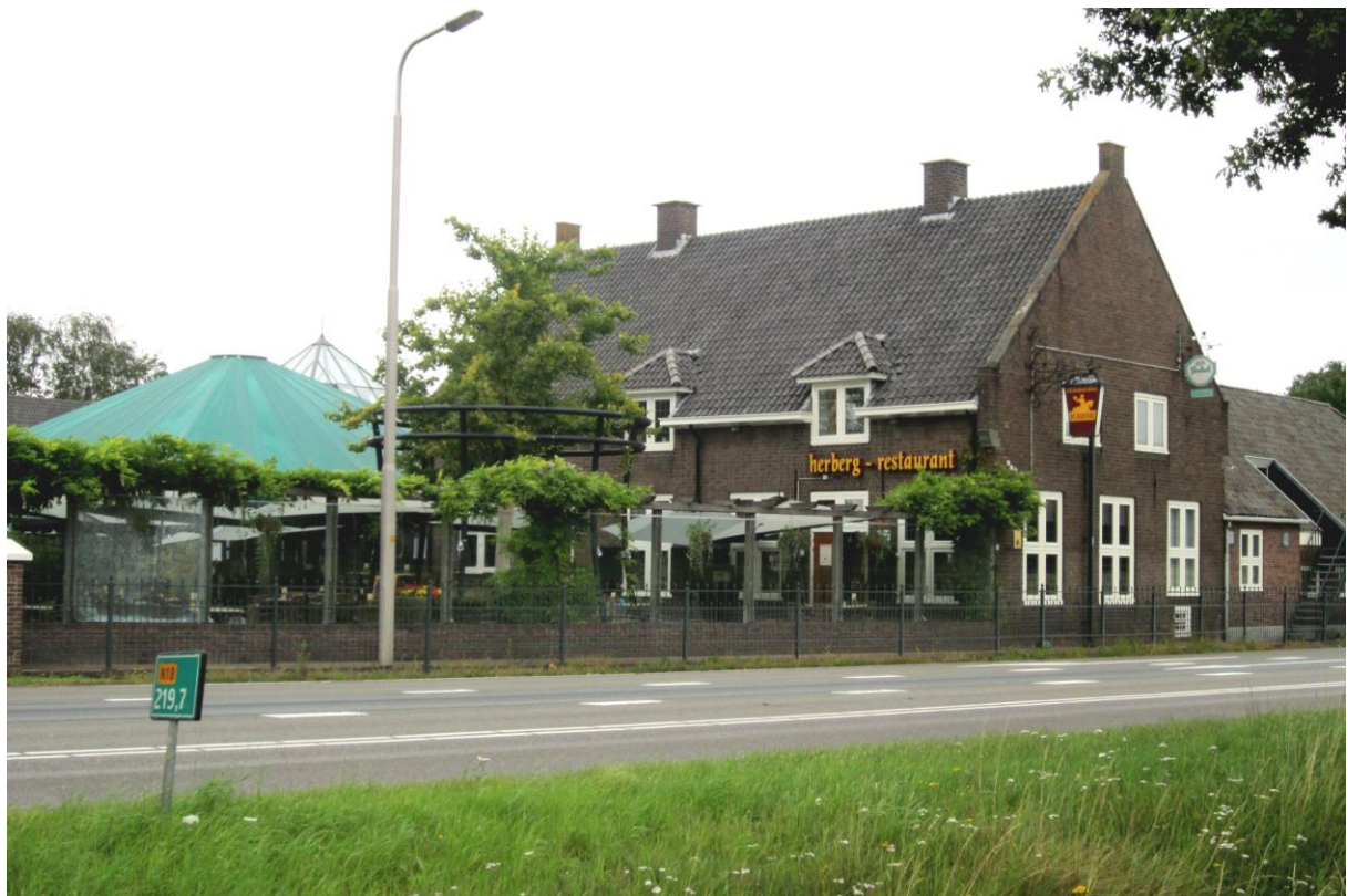
Herberg De Radstake