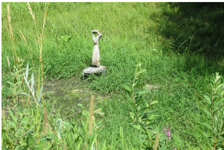
Foto's van het Boekekeerlspad: heideveld en vijver met slachtoffer.