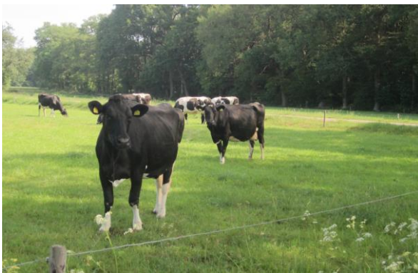
Belangstelling voor de wandelaars