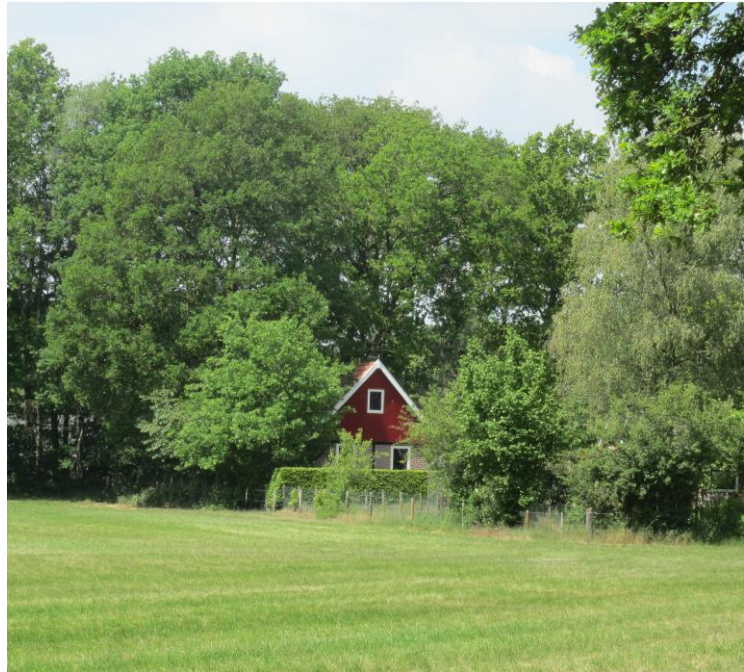
Boerderij bij Aalten.

Vanaf de Grote Steen de Wooldseweg in de richting Bocholt. Na ruim 100 meter RA, Blekkinkhofweg. Bij paddestoel 22571 links aanhouden. Vanaf hier volgt u het geel-rood van het Scholtenpad. Even verder RD, Boomkampweg. Later RA, Drenthelweg. Op een driesprong LA, doodlopende weg. Iets verder RA, smal wandelpad. Bij een boerderij LA. Einde LA, een asfaltweg. Bij huisnummer 6 RA. Op asfaltweg LA. Met de bocht mee naar links, einde geel-rood. Iets verder RA, Kroondijk. Op vijsprong tweede weg RA, Huiskermatedijk. Deze 1,7 kilometer blijven volgen. Dan LA, Loohuisweg. Deze wordt zandweg en verderop weer asfaltweg. In de bebouwde kom eerste voetpad rechts. Het woonerf rechtdoor oversteken, een doodlopende weg. RA naar de overweg. 75 meter na de overweg LA, Ludgerstraat. Deze helemaal uitlopen tot het station.